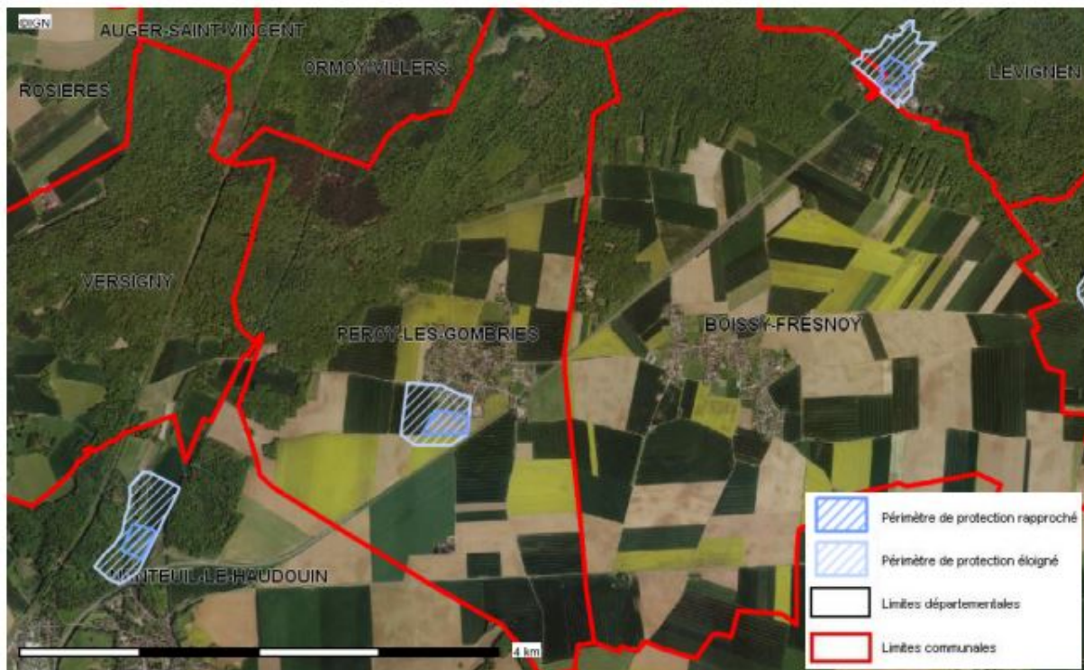
Carte publiée par l'application CARTELIE © Ministère de la Transition Écologique CP2I (DOMETER)